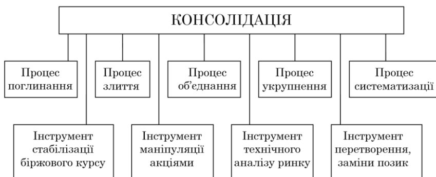
Рис. 1. Змістове навантаження поняття «консолідація»

Розглянемо більш детально сутність консолідації та особливості її виявів у банківському секторі. В економічній літературі з дослідження банківської діяльності достатньо широко висвітлюється поняття банківської консолідації; й здебільшого автори дотримуються єдиної позиції, що консолідація — це об'єднання інституцій (банків) для досягнення спільної мети [10–14], але при цьому не уточняється, яка саме мета може вважатися спільною для учасників консолідації.