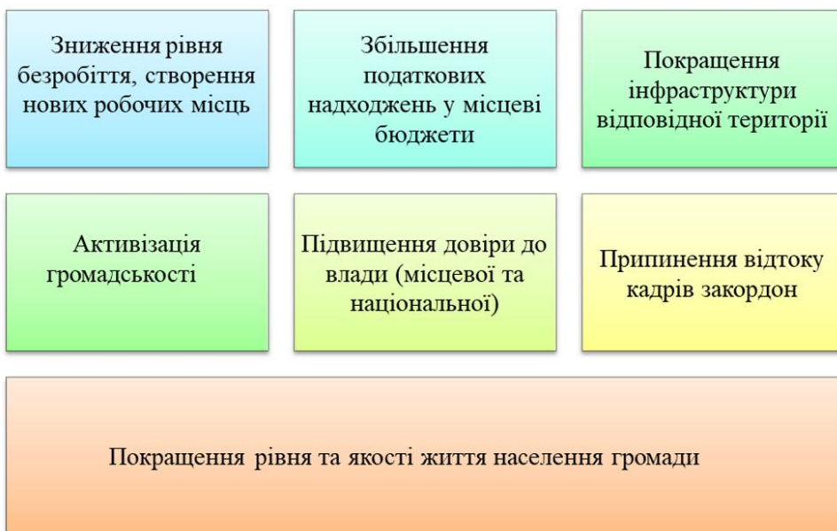
Рис. 2. Ефект реалізації механізму соціального партнерства

Загалом, ми вважаємо, що нині застосування такого інструмента, як механізм соціального партнерства, є гарним джерелом для нарощення економічної сили територіальних громад та формування правильного вектора руху. А його ефективна реалізація забезпечить сталість економічного життя відповідної території громади (рис. 2).