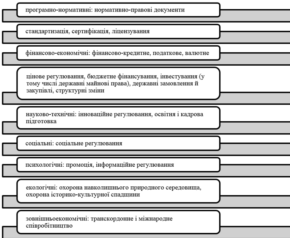
Рис. 3. Форми реалізації методів державного управління сфери туризму [6]

врахуванням вияву підприємницького потенціалу в туристичній сфері, а також сприяння комплексному розвитку певної території через призму міжгалузевої співпраці, забезпечення екологічної безпеки. Зважаючи на це, доцільним є гарантування ефективного соціально-економічного впливу впровадження різноманітних туристичних функцій (рекреаційної, інтеграційної, економічної, екологічної, інформаційної, соціальної, просвітницько-виховної, культурної, політичної), мінімізація (повна чи часткова) наявних ризиків, обумовлених функціонуванням туристичної галузі, мінімізація впливу зовнішніх факторів на розвиток туристичної сфери для створення оптимальних умов оптимізації галузі [5].