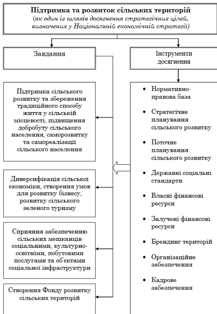
Рис. 1. Завдання Національної економічної стратегії щодо розвитку сільських територій та інструменти їхнього досягнення

Примітка: складено автором на основі [1, с. 93].