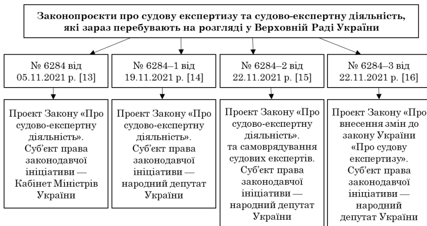
Рис. 1. Альтернативні законопроекти про судову експертизу та судово-експертну діяльність

Примітка: складено авторами за даними офіційного сайту Верховної Ради України.