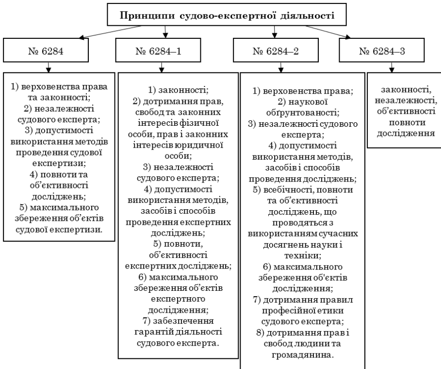
Рис. 3. Декларування принципів судово-експертної діяльності у запропонованих законопроектах