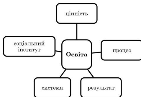
Рис. 2 Категорії трактування поняття освіти