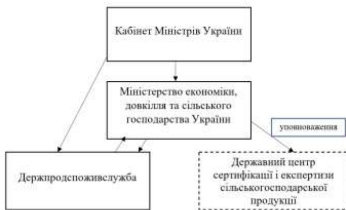
Рис. 1. Структура управління та регулювання у сфері насінництва та розсадництва

ції і експертизи сільськогосподарської продукції» є органом з оцінки відповідності, що входить до сфери управління. Мінекономіки. Взаємозв'язок між органом з оцінки відповідності та органом, що здійснює державний контроль у сфері насінництва та розсадництва, відсутній. Структуру управління та регулювання у сфері насінництва та розсадництва можна представити у вигляді схеми (рис. 1).