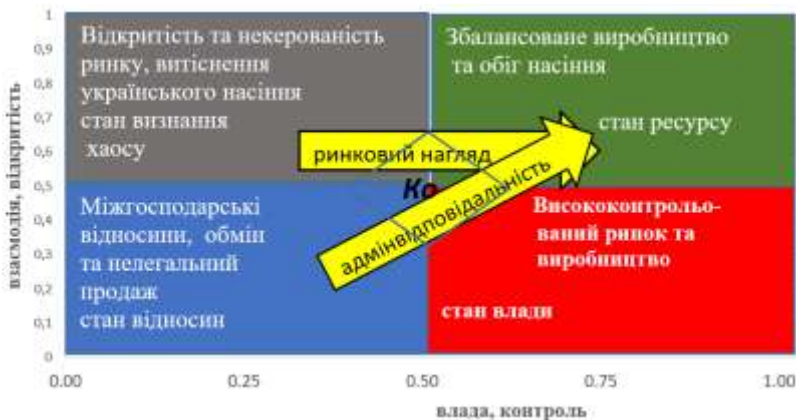
Рис. 3. Перехід до збалансованої системи через функціонування компетентного органу ( Ko )

Перехід від станів міжгосподарських відносин, обміну та нелегального продажу, хаосу обігу можливий через точку переходу, функціонування компетентного органу (позначено на схемі Ko ). Який втілює принципи контролю, конкуренції, пріоритету якості продукції. Зі схеми-графіку можна зробити припущення, що така структура повинна бути уповноваженою проводити контрольні функції до 50 % функціоналу, узгоджувати обіг насіння, створювати фільтри (ринковий нагляд) для недопущення нелегального продажу та погіршення якості. Причому збільшення частки експансії іноземних сортів передбачає збільшення контролю (рис. 3).