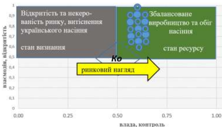
Рис. 5. Ризикоорієнтований підхід ринкового нагляду — «решето»

Відповідальність повинна становити 100 %. На схемі це воронка, в якій немає місця, яке не дозволяє фальсифікату вийти в обіг. Цей постулат реалізується через проєктні повноваження компетентного органу — здійснення державного контролю за обігом насіння на території України. Контроль відкритого ринку насіння для збалансованості повинен базуватися на ризикоорієнтованому підході, своєрідному «решеті». Визначення критичних точок застосування відповідних механізмів (рис. 5).