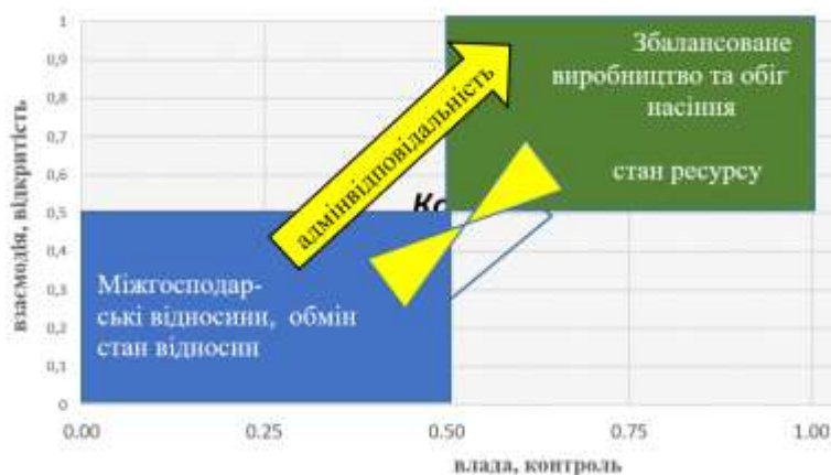
Рис. 4. Адміністративна відповідальність за принципом «воронки»

Перехід до збалансованої системи обігу насіння, назвемо її станом ресурсу, дозволяє використовувати власні ресурси системи для розвитку. Відповідальність за порушення прав на сорти рослин, незаконний обіг насіння та садивного матеріалу повинна спрямувати кошти з нелегального ринку на забезпечення селекції та насінництва (рис. 4).