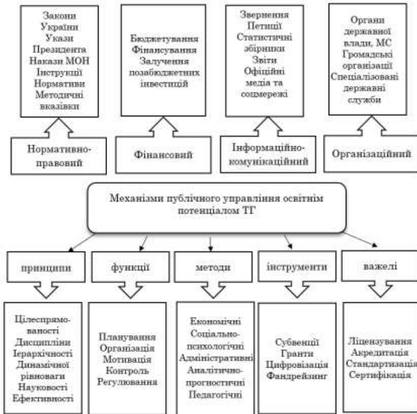
Рис. 4. Концептуальна схема механізмів публічного управління освітнім потенціалом ТГ