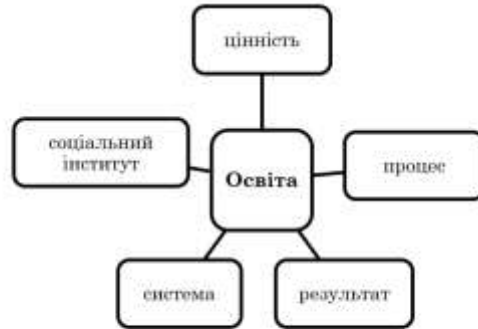
Рис. 2 Категорії трактування поняття освіти