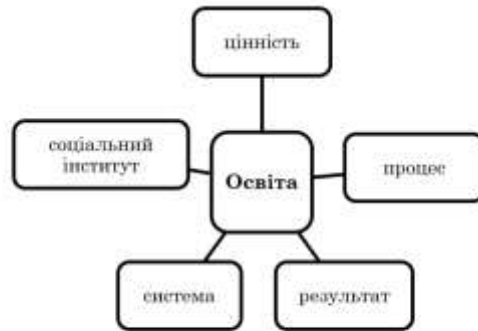
Рис. 2 Категорії трактування поняття освіти